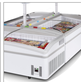
Installation en îlot, tablettes en option