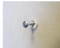
Cheville Plak nylon - vue en situation