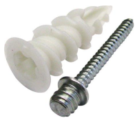
Cheville Plak nylon avec patte à vis M7