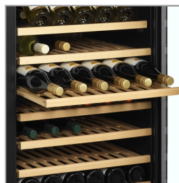
Tablettes à tiroir en bois